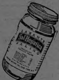
Un producto de Bristol-Myers Co.