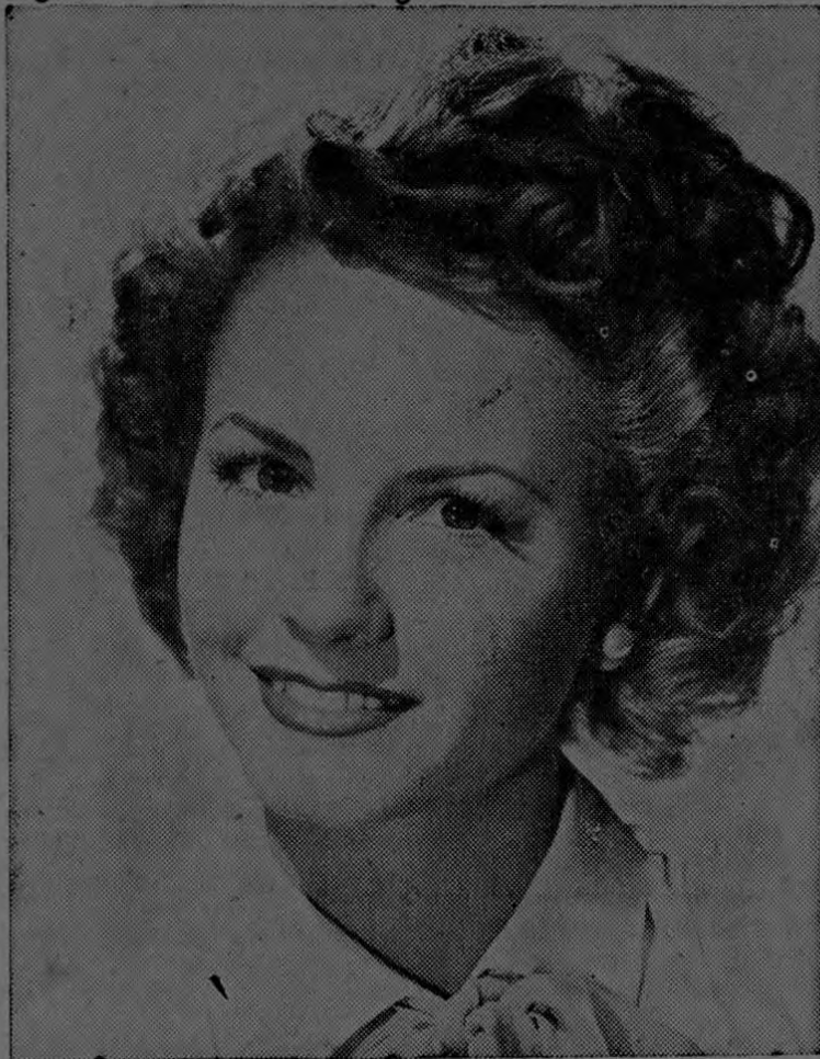
JANET BLAIR, estrella de Columbia Studios, es una actriz que no necesita modelarse facción alguna por medio del maquillaje, según afirma el experto de Hollywood Max Factor Jr.

La apreciación de estos principios de ilusión fué un lógico prelude de las prácticas de "modelado del contorno" que durante el año pasado hicieron papel tan importante en las creaciones de maquillaje avanzado. El modelado del contorno requiere una exacta apreciación de las condiciones esculturales que presenta la cara humana. Consideramos, por ejemplo, el caso de una mujer que tiene los pómulos demasiado prominentes. Si quiere hacer que parezcan menos prominentes, puede